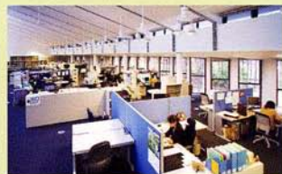
项目研究室楼层 研究推进中心

研究栋1层为包括15个项目研究室及研究推进中心在内的大型空间。所有空间为全开放式，便于相互往来及随时进行各种交流。